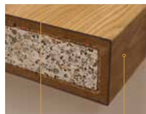
Komplette Ummantelung einer freistehenden Steinstufe ohne Blende. Kann nach Bedarf mit Vinyl oder Holzparkett abgedeckt werden.