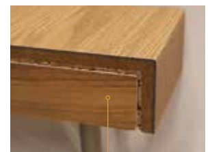
Stirnseite bei freistehender Treppe mit Klebefliese bzw. Holz-Deckschicht kaschiert.