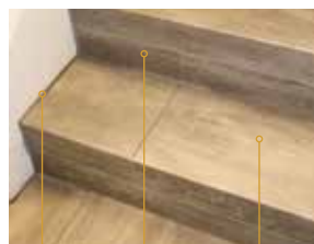
Mit Silikonfuge Setzstufe (Stirnseite) im gleichen Dekor mit Versatz Trittstufe mit Stoß