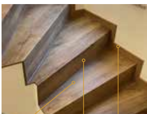
Trittstufe ohne Stoß Setzstufe (Stirnseite) im gleichen Dekor Mit passender Sockelleiste