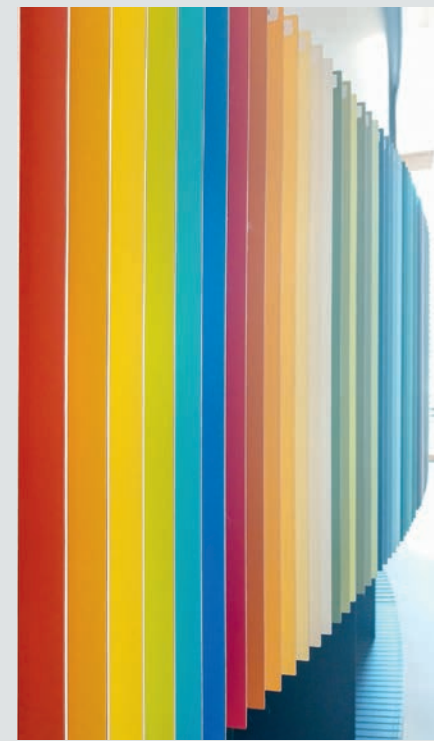
Auf grossen Musterflächen sind alle Colibri-Farben und Oberflächen präsentiert.