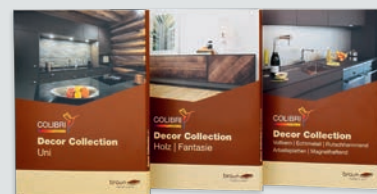
In den drei Musterkartellen können alle Decore dem Kunden übersichtlich präsentiert werden.

Ausstellung auf 1600 Quadratmetern «Holz erleben» heisst es in der Ausstellung bei der BRAUN AG in Gossau (SG).