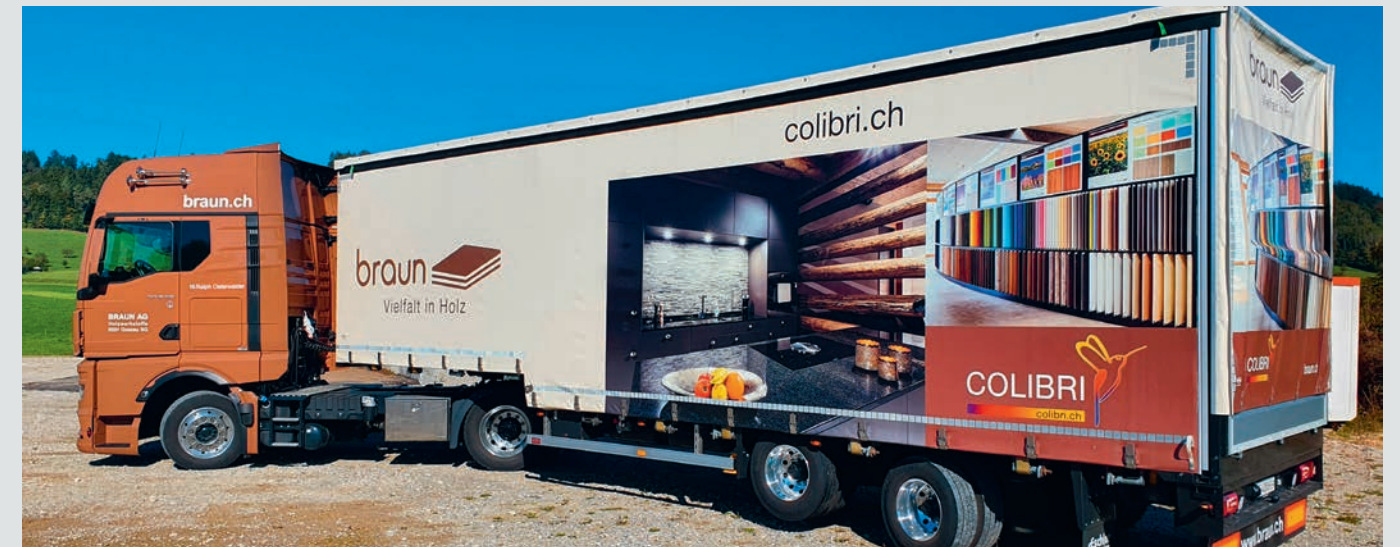
BRAUN ist täglich für die Kunden unterwegs.

Auf colibri.ch geben zahlreiche Objektfotos einen ersten Eindruck der Einsatzmöglichkeiten für den eigenen Wohnraum. Zwölf Farbwelten helfen bei der Zusammenstellung passender Farben aus den Bereichen Xtreme Plus Matt, Uni, Holz, Metall, Fantasie, Hochglanz und